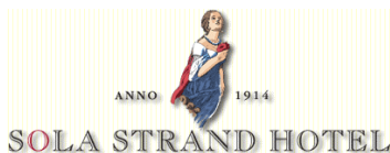
SOLA STRAND HOTEL